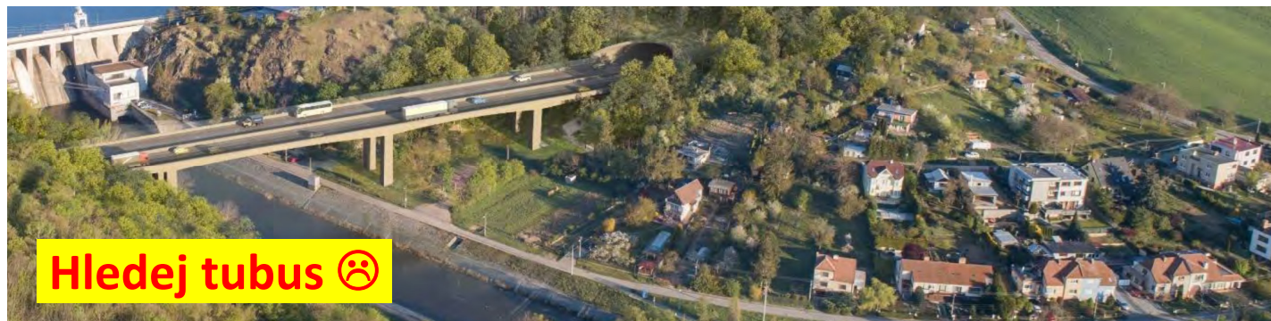
Vizualizace knesl kynčl architekti a projektové kanceláře Ossendorf, zveřejněno 18.6.2020